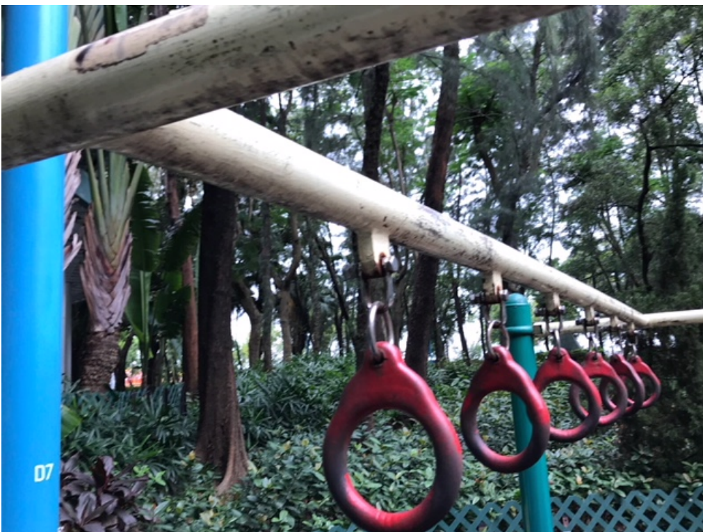
吊環油漆剝落情況