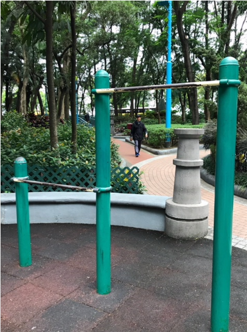
手握杠油漆剝落情況