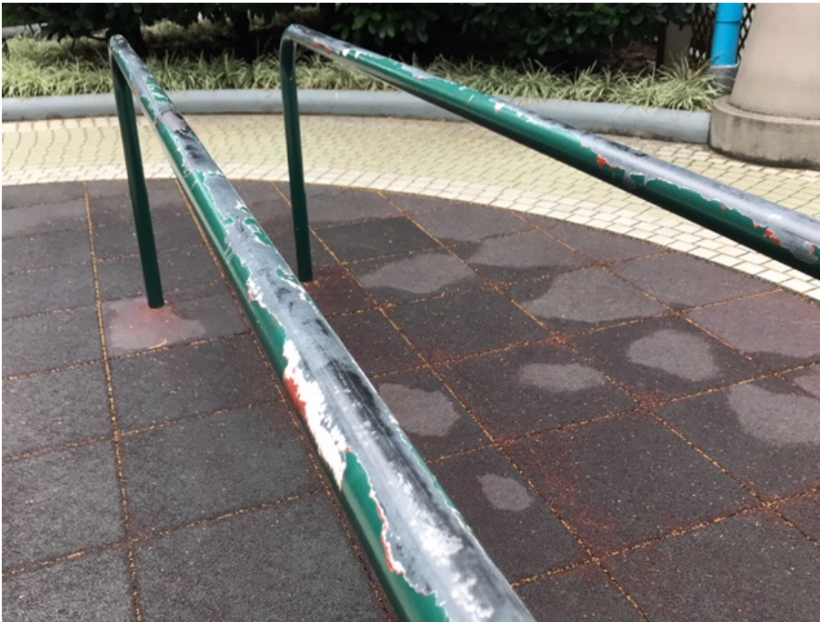
平衡杠油漆剝落情況