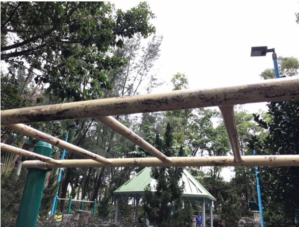
吊杠油漆剝落情況