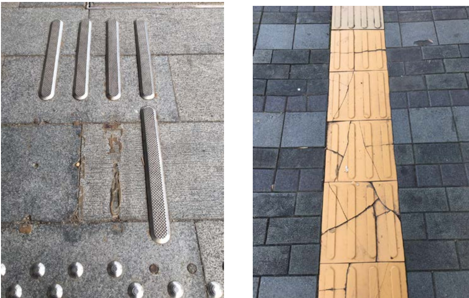
2. 中山紀念公園內導盲道破損，影響美觀。