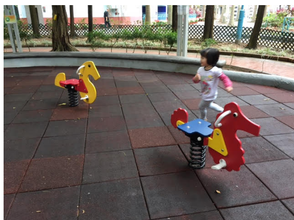
5. 卑路乍灣公園搖搖馬。