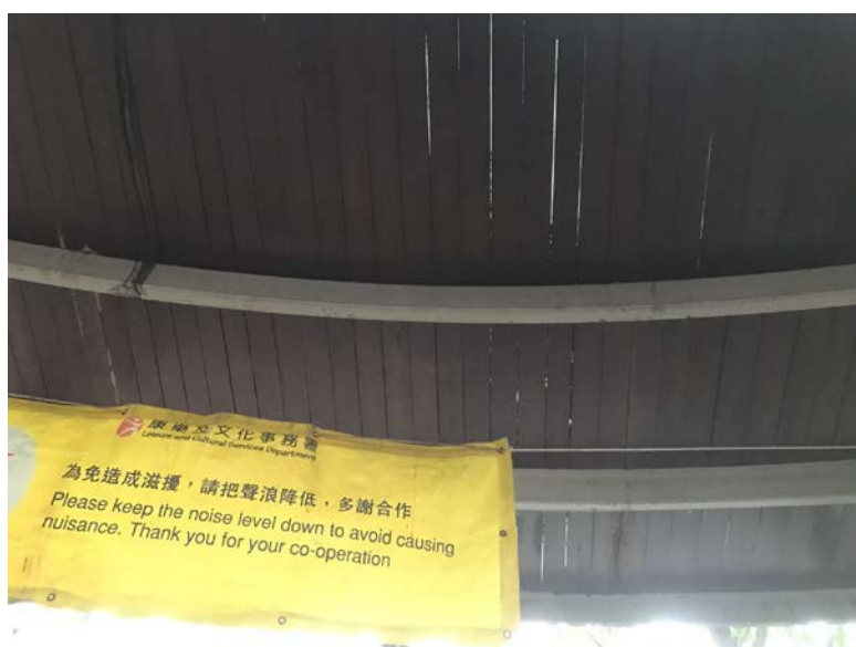
4. 卑路乍灣公園內擋雨遮陽的簷篷疏漏。