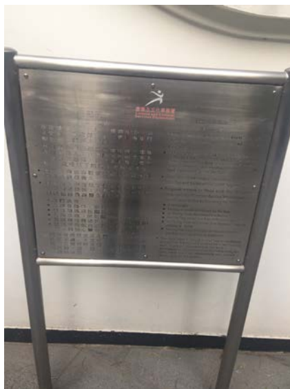
3. 香港公園內告示牌指示不清晰。