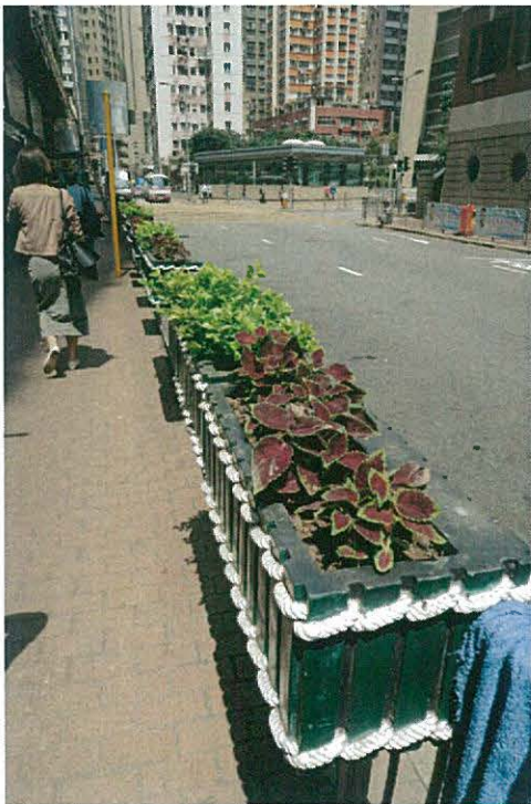
掛式花盆參考 附件一