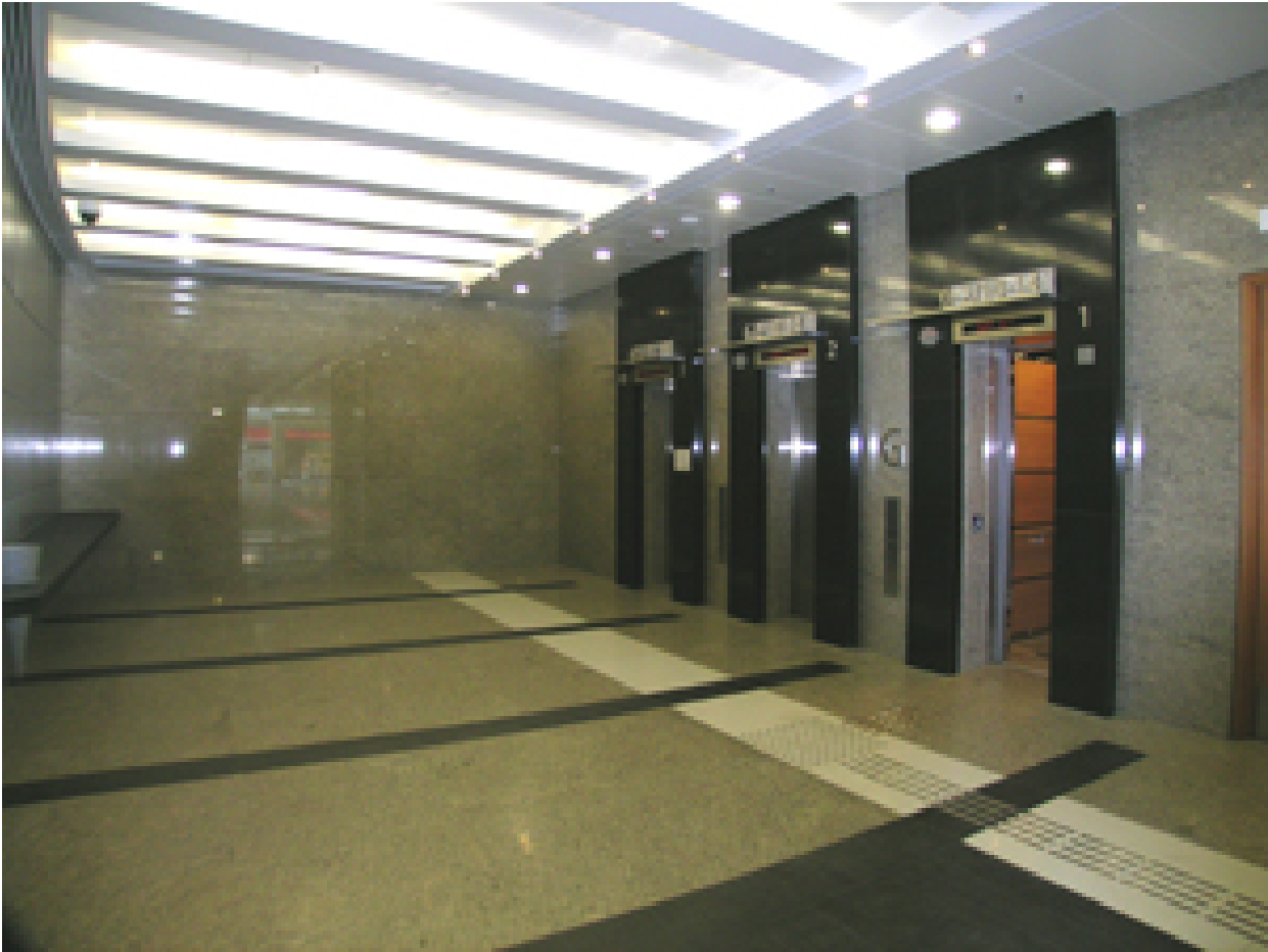
堅尼地城社區綜合大樓升降機