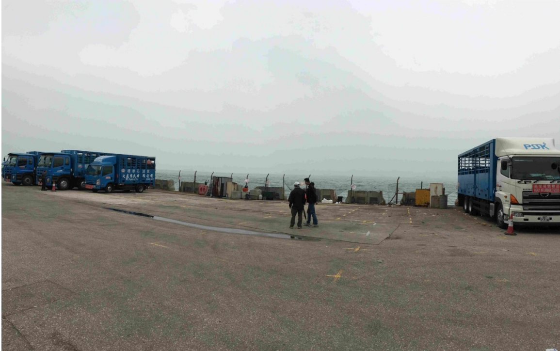
東邊街北停車場 現時狀況