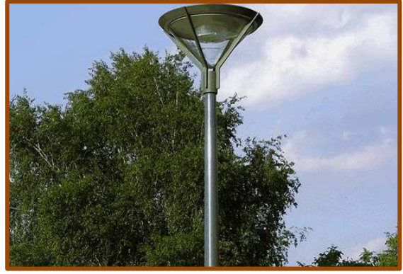
東邊街北停車場 現時狀況