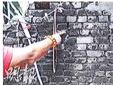
強哥說，這些灰黑色的磚，是青磚，歷史比紅磚長。