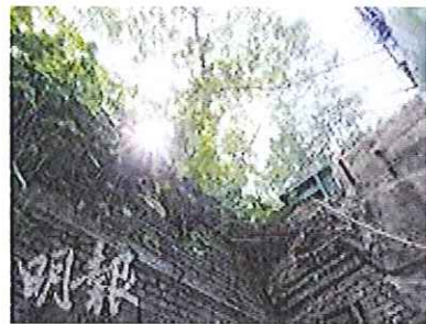
中環扶手電梯旁，原來有一個小廢墟，裏頭是估計有百年歷史的排屋，屋頂已塌，但仍有幾堵青磚破牆。