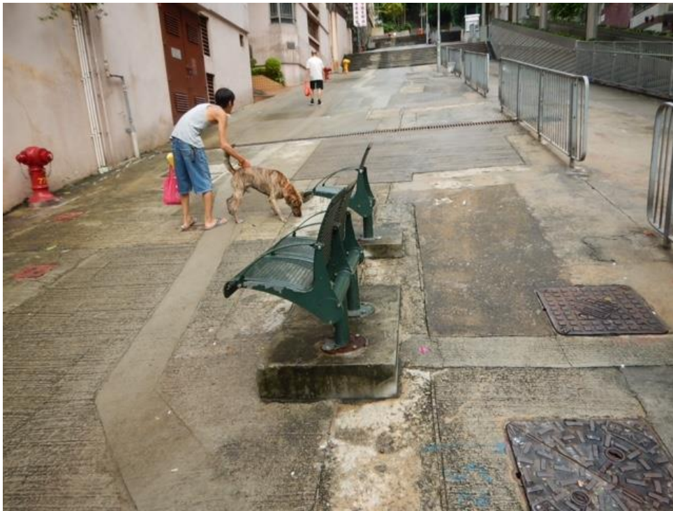
山市街原來的三張椅子