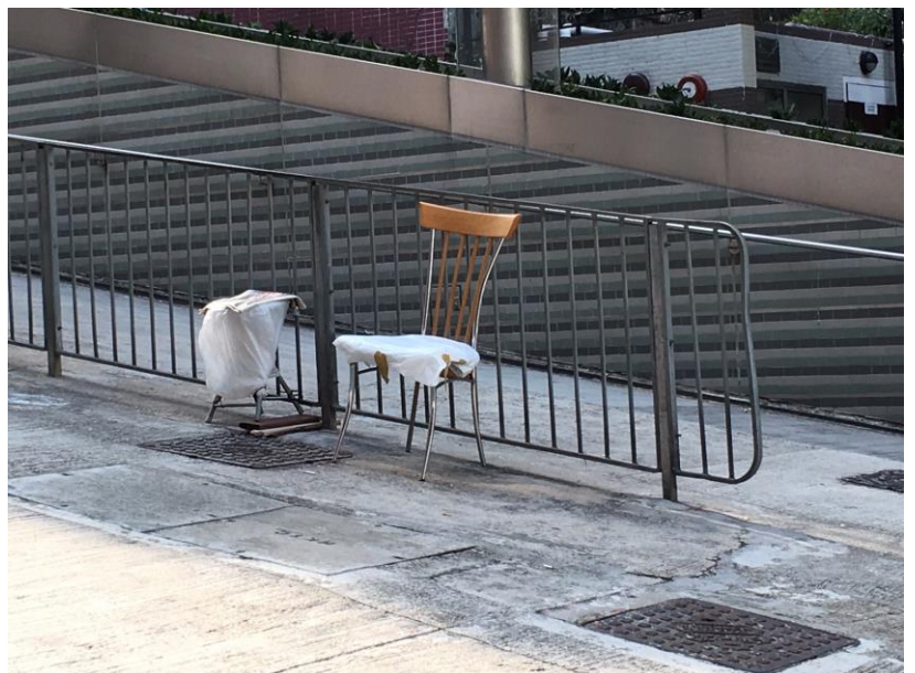
需重新裝回三張椅子