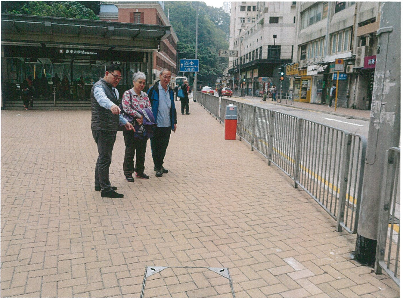
# 居民反映上述地段缺少綠化植物