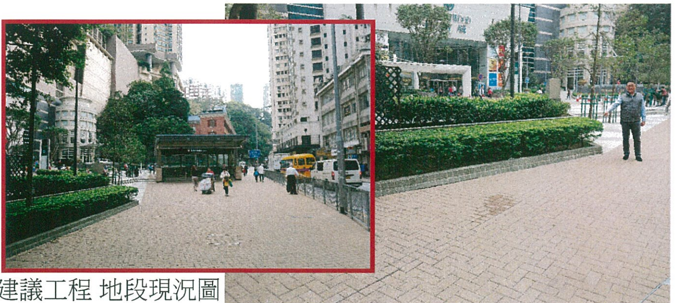
建議工程 地段現況圖