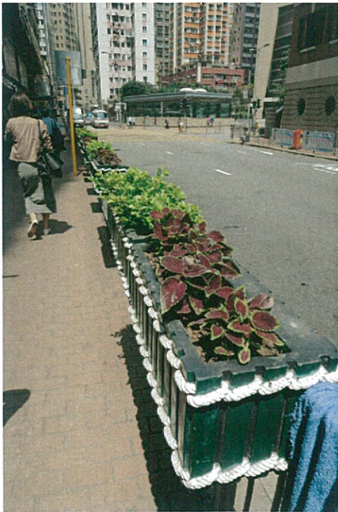
掛式花盆參考 附件一