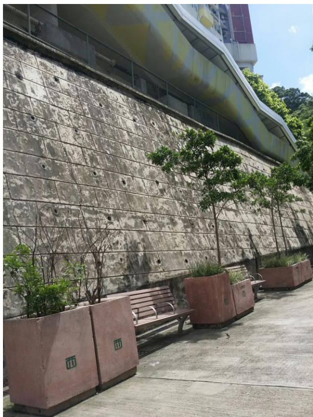
附圖二：(座椅需加上蓋)