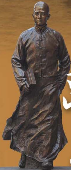
孫中山 Dr Sun Yat-sen (1866-1925)