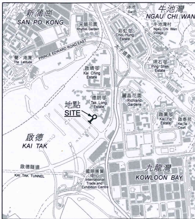
比例 SCALE 1:20 000