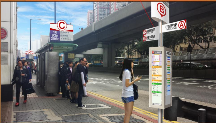
觀塘道 (葵涌方向) KWUN TONG ROAD (KWAI CHUNG BOUND)

Disclaimer: Artist's Impression for illustrative purpose only. Design subject to change