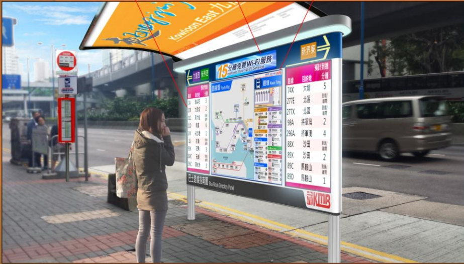
巧明里 (葵涌方向) HOW MING LANE (KWAI CHUNG BOUND)

Disclaimer: Artist's Impression for illustrative purpose only. Design subject to change