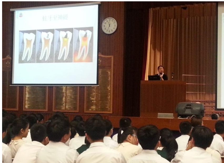
本院牙科醫生為中學生講解常見的口腔疾病及預防方式， 同學們均全神貫注地聆聽