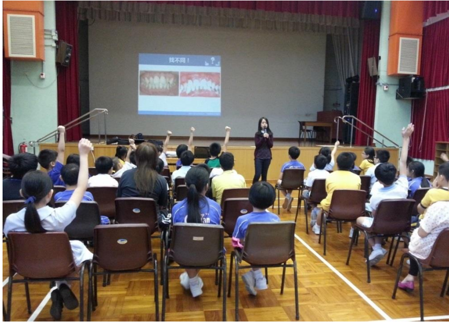
本院牙科醫生為小學同學提供口腔護理講座， 同學們積極參與，踴躍發問