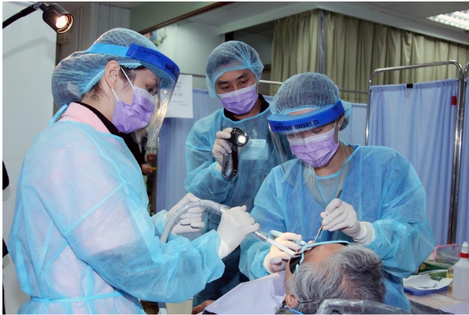
除口腔檢查外，本院牙科外展隊會因應長者的需要，提供有關跟進服務