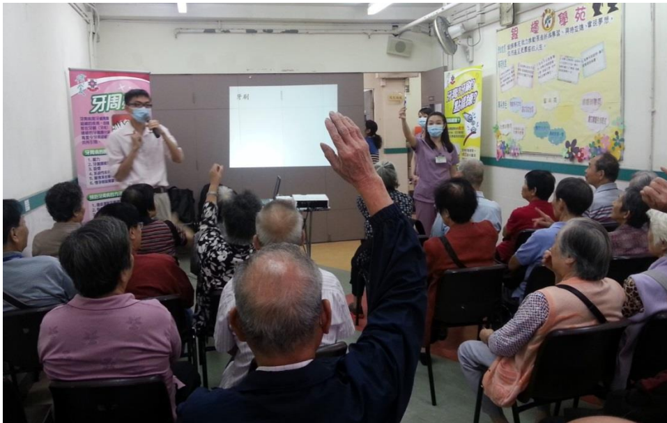
長者於口腔護理講座中積極參與，向牙科醫生查詢有關常見的口腔問題