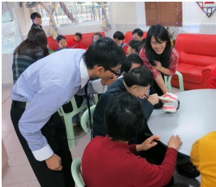
本院牙科醫生親身教授護理口腔的技巧，讓活動參加者可即時實習