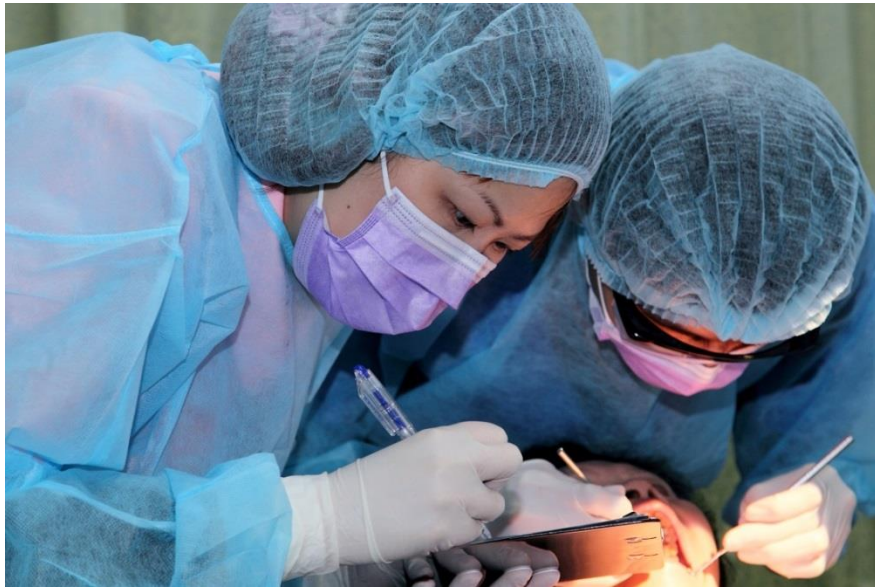
本院牙科醫生及牙科助護專業用心地提供牙科外展服務

本院牙科外展服務除參與由政府資助的牙科外展計劃外，更與不同的社區機構合作如電台、學校、院舍、長者日間中心、長者地區中心、綜合服務中心，弱能人士宿舍及工場等，透過提供口腔護理知識分享、口腔健康講座及口腔檢查等活動，用身體力行的方法喚醒市民對口腔健康的關注。