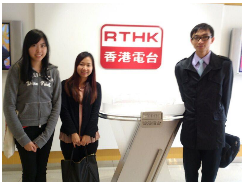
本院牙科醫生應【善報】邀請，於節目中與聽眾分享有關假牙及口腔護理等知識