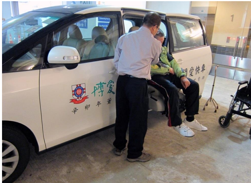
本院之「醫護關愛快車」為有需要長者提供免費接送服務