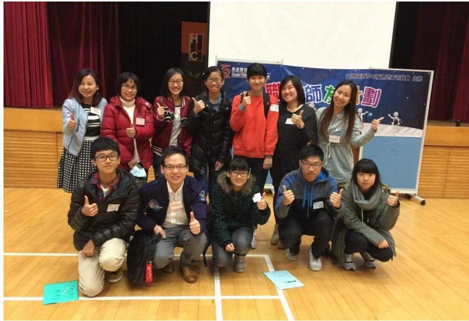
本院牙科服務參與由社會福利署舉辦之「職場師友計劃」， 安排同學到本院牙科診所進行工作體驗