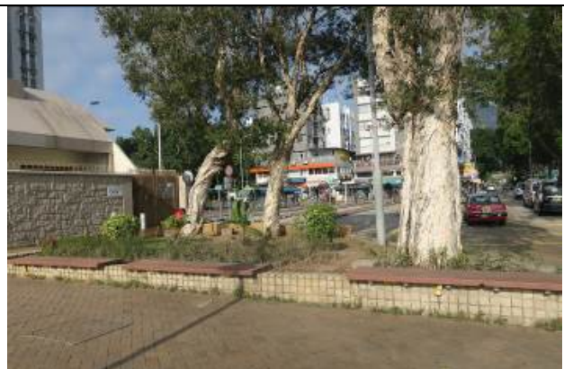
惠民路近西貢巴士總站路邊花床