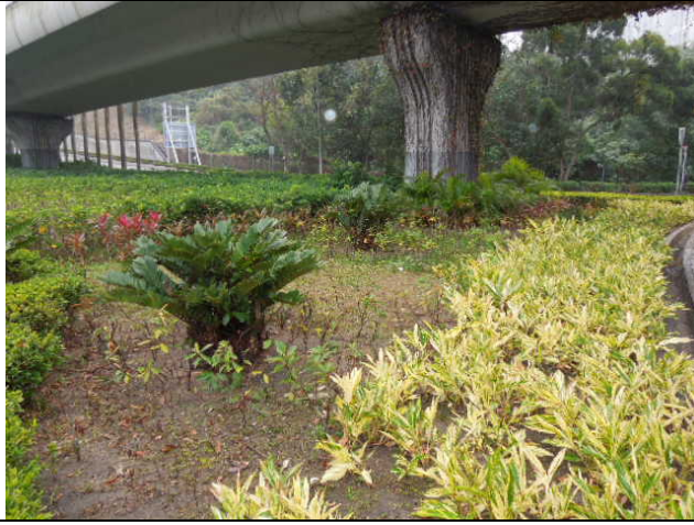
昭信路往環保大道迴旋處