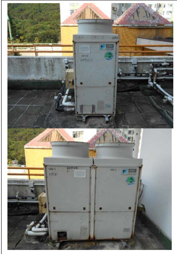
現有位於天台的冷氣機組