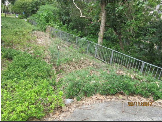
寶琳港鐵站上蓋路邊花床