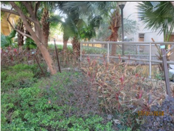
寶琳北路近康盛花園入口花床