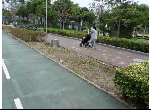
寶康路近香港單車館路邊花床