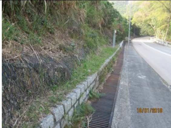
清水灣大坳門路麻石花床