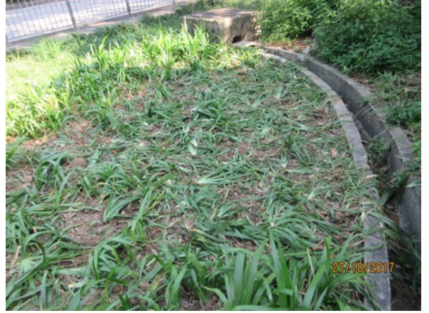
寶琳北路近將軍澳隧道入口路邊花床