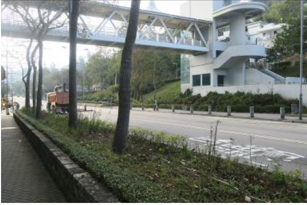
西貢公路(油麻蒲街與康健路交界)花床