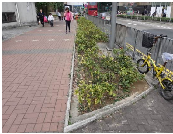
常寧路近坑口地鐵站路邊花床