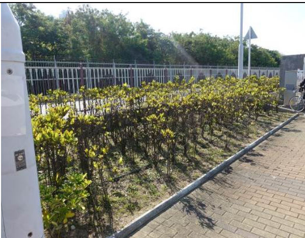
743CL 近環保大道寵物公園花床