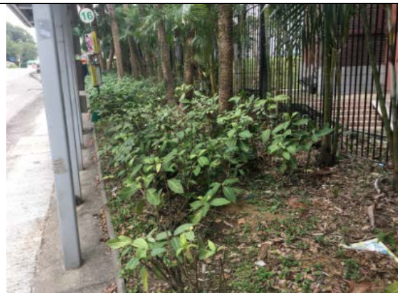
清水灣道三育書院入口