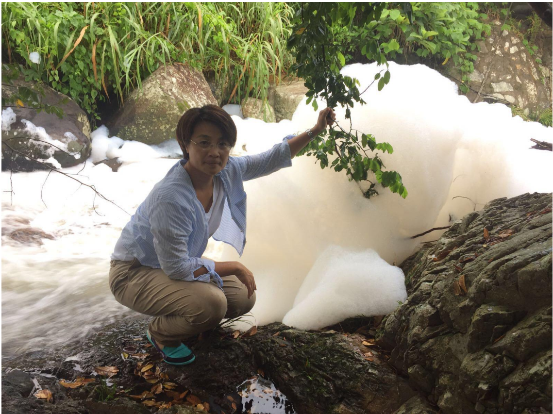
將軍澳上村小夏威夷徑溪流出現白色泡沫