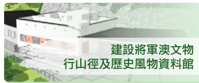
建設將軍澳文物行山徑及歷史風物資料館