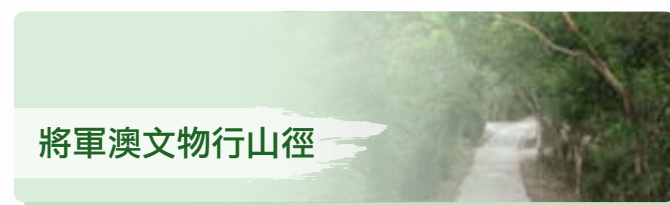
將軍澳文物行山徑