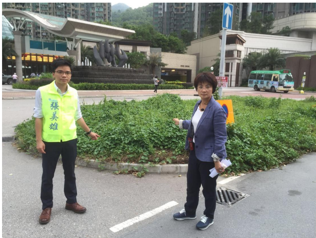
將軍澳石角路 8 號(峻滢)外草地實景圖