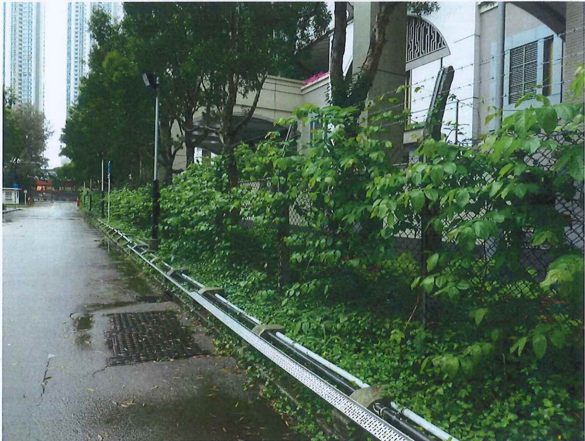
加種攀緣植物後 (拍攝於 2017 年 4 月)