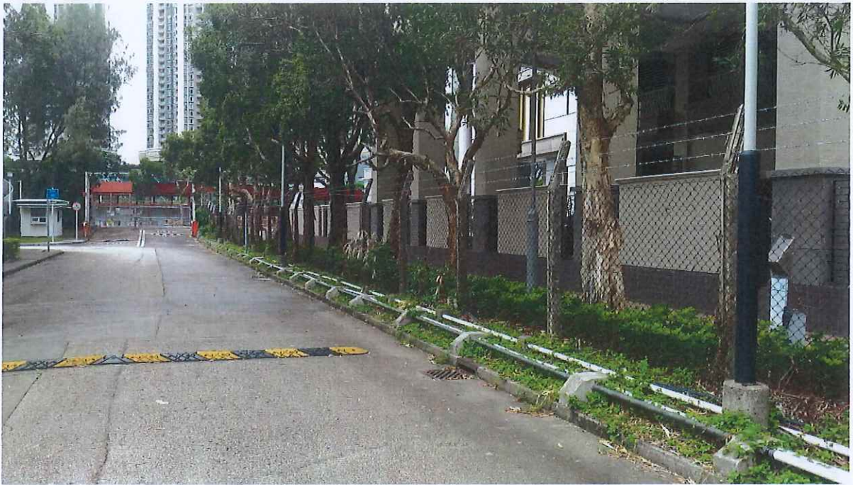
加種攀緣植物前 (拍攝於 2016 年 10 月)