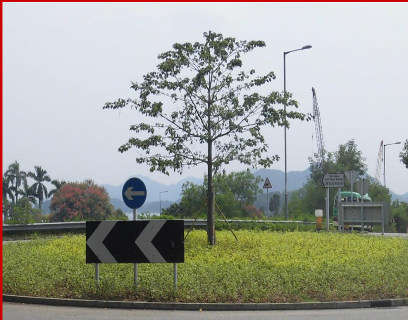
惠民路和大網仔路交匯的迴旋處 (2015年9月完成)