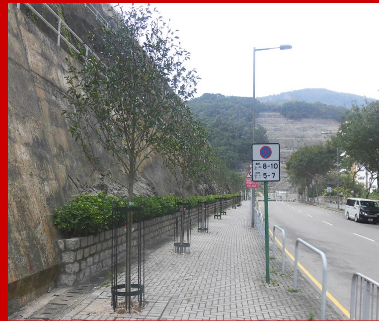
翠嶺路行人路 (2015年11月完成)