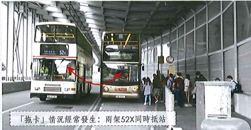
攝於2015年10月13日早上8時29分於豪景花園