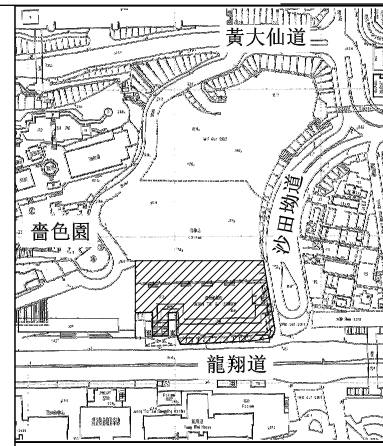
SITE PLAN SCALE: 1:5000