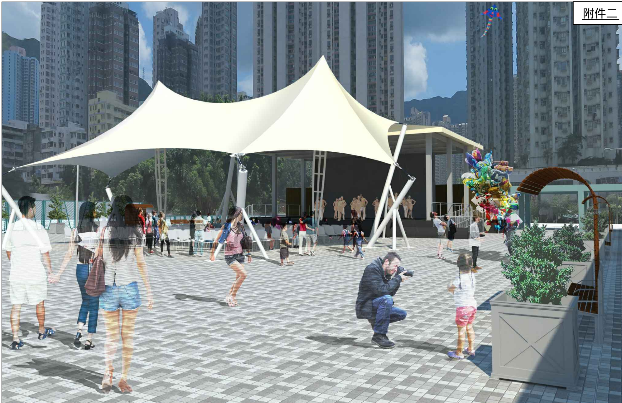
7455RO 黃大仙廣場擴闊及改善工程 EXPANSION AND IMPROVEMENT OF WONG TAI SIN SQUARE