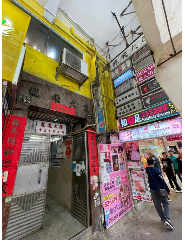
旺角亞皆老街 36-38 號龍飛大廈