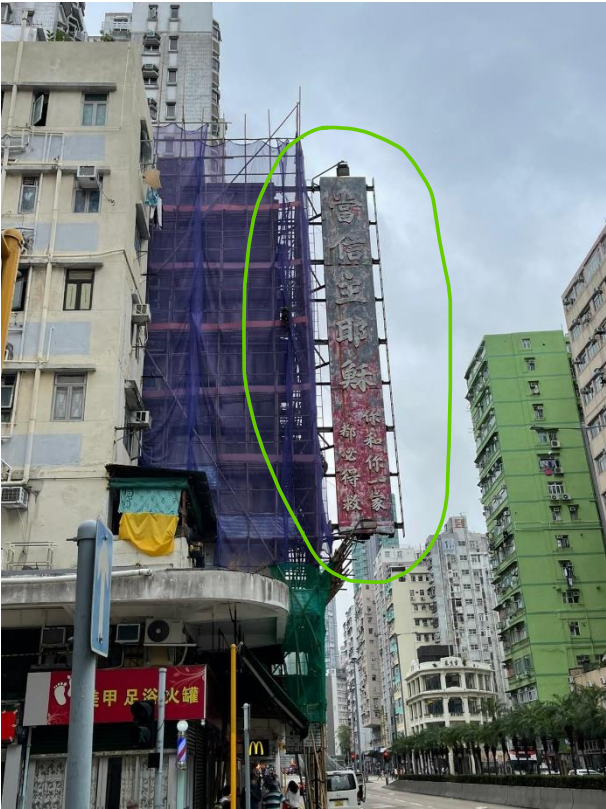
旺角荔枝角道 150-174 號