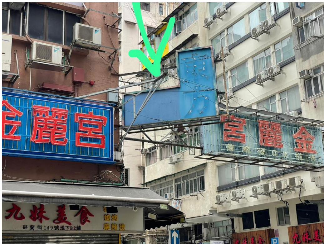
旺角砵蘭街 149 號