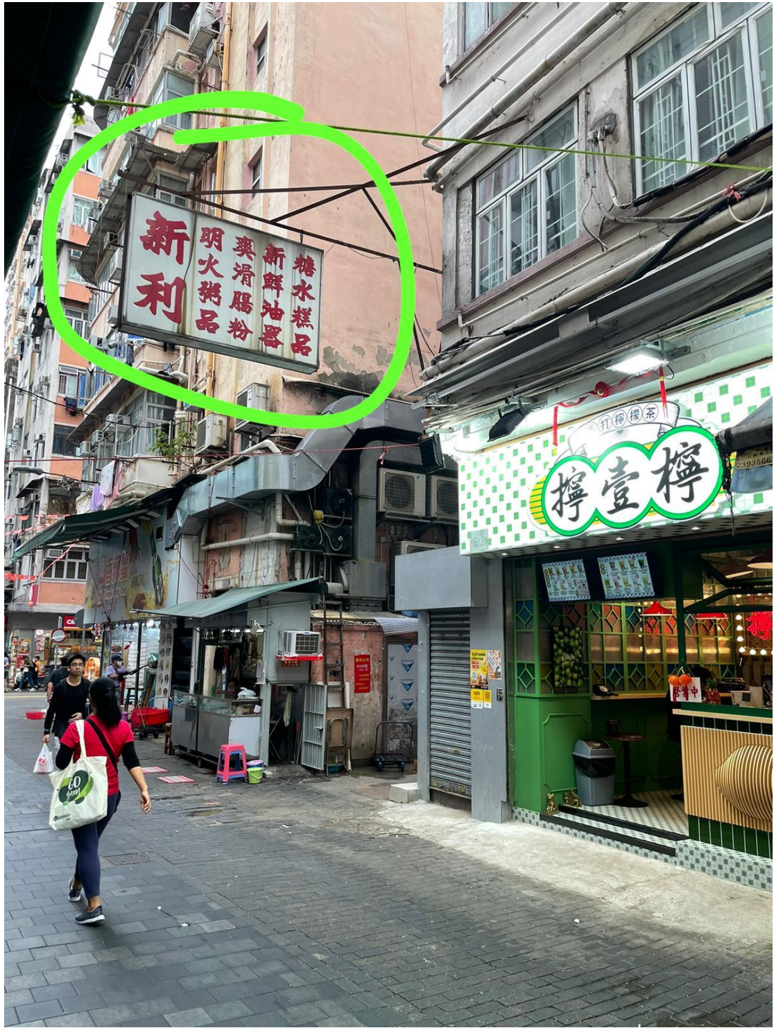
油麻地南京街 1 號 F 對面