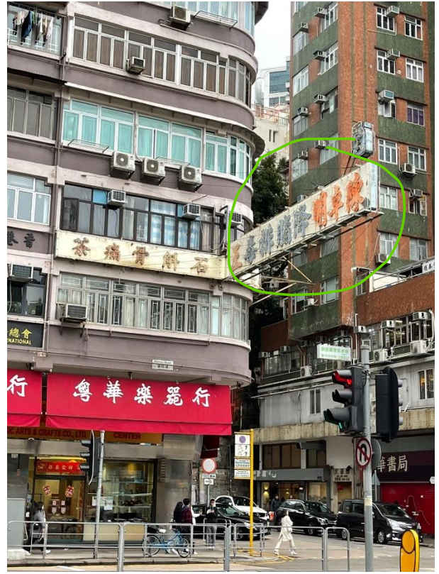
油麻地彌敦道約 450 號