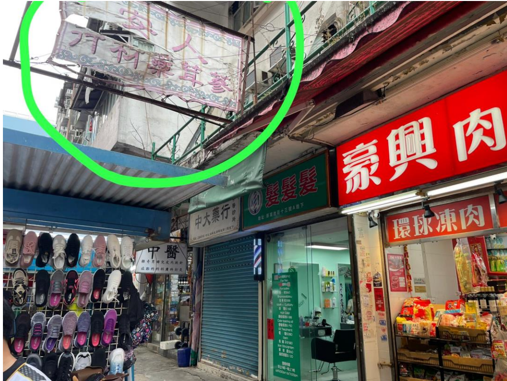
油麻地新填地街 13A 地下