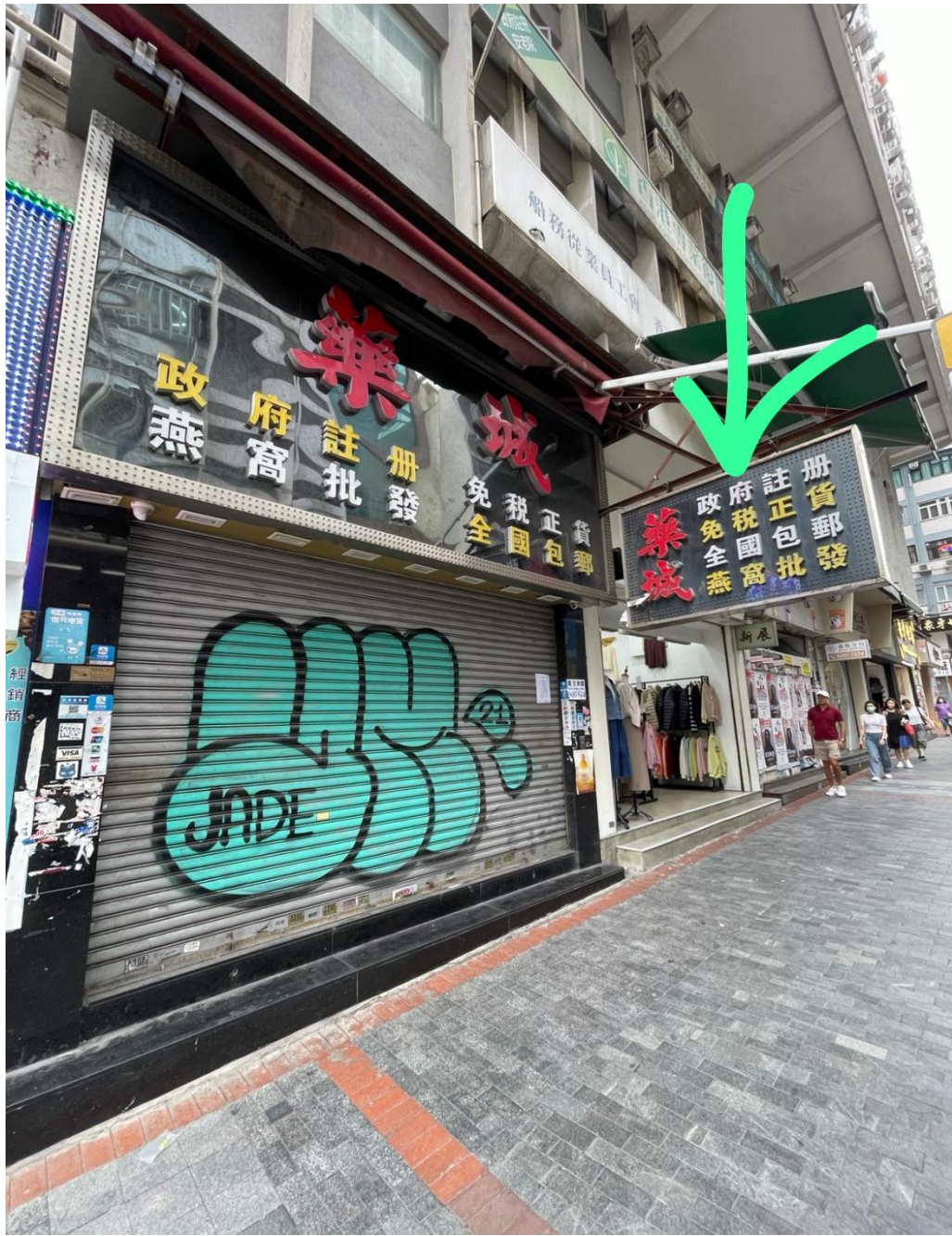
彌敦道約 340 號