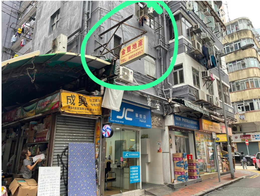
吳松街 77 號