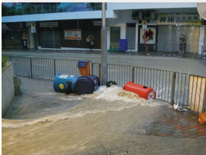
暴雨下的堅尼地城