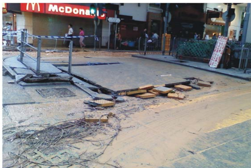
暴雨後的區內路面情況