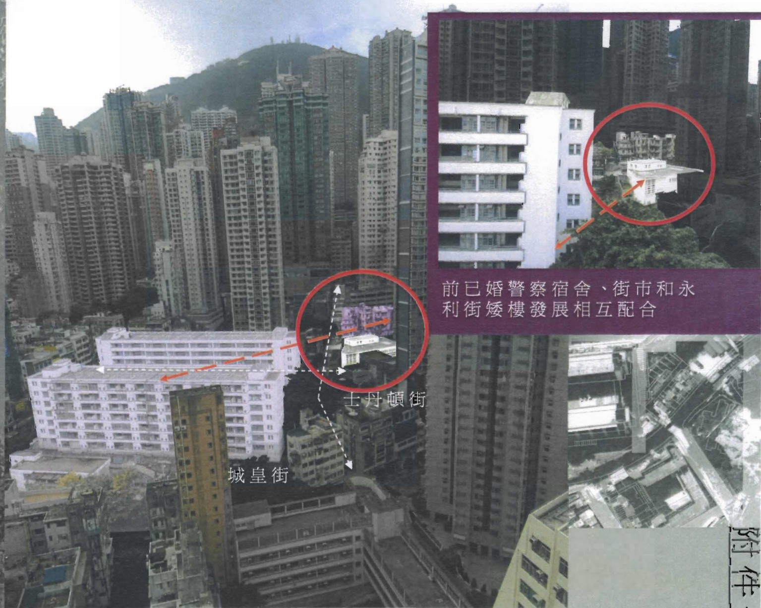
前已婚警察宿舍、街市和永利街矮樓發展相互配合

街市頂部的空間令 前已婚警察宿舍與 H19項目在視覺、 氛圍以及活化層面 上能相互配合並連 繫起來