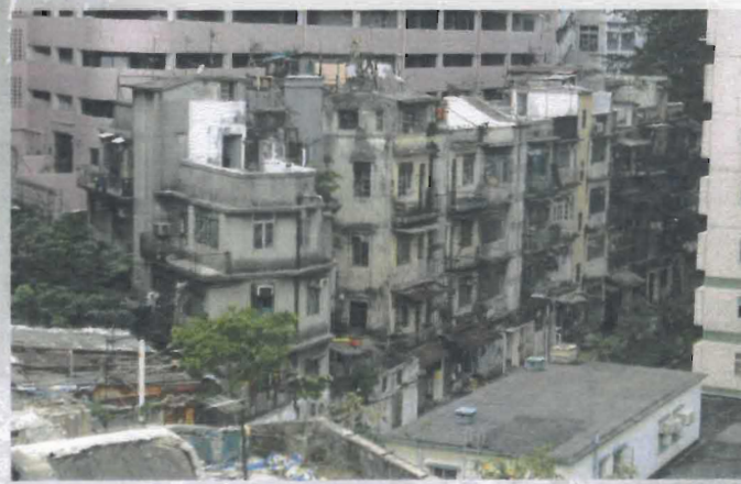
永利街現時的建築群