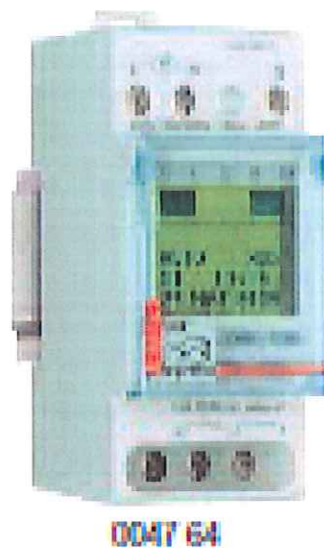
日出日落智能時間掣