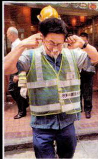
◆ 爆炸震耳欲聾，其中一名傷者送院時手按雙耳。