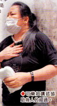
◆ 可樂姐講述協助救人的經過。

食環署發言人指已要求有關清潔公司提交詳細報告，若發現該公司在履行合約期間，有不妥善之處，會根據有關合約條款處理。