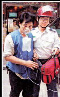
◆ 其中一名工人要戴上氧氣罩協助呼吸。