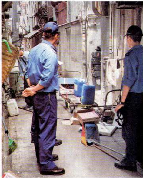
◆爆炸現場還有三個疑載化學品的膠桶，消防到場調查。