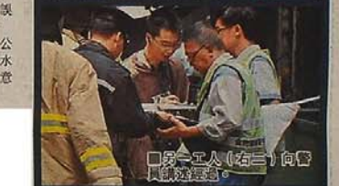
男工（右三）向警員報告經過。