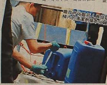
政府化驗師人員抽取桶內的清潔劑樣本化驗。