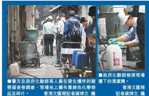
■警方及政府化驗師等人員在發生爆炸的謝斐道後巷調查，現場地上遍布黃綠色化學物品及碎片。香港文匯報記者蔣焯文 攝 ■政府化驗師檢視現場遺下的清潔劑。香港文匯報記者蔣焯文 攝

4名傷者所屬清潔服務公司董事總經理甄韋喬表示，公司有明確指引，員工只可稀釋清潔劑使用，不可將不同的清潔劑混合，訂購的化學品亦有清晰的使用標籤，相信今次事件是有人「貪得意」或用了自己的想法去做，違返指引造成意外。