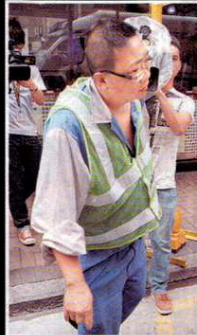
◆ 另一名不適的男工由救護員送院救治。