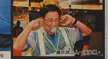
姓陸工人一度失聰。