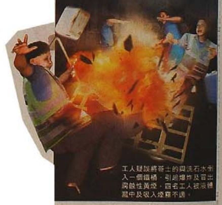
工人疑誤將哥士的與漂白水混入一個鐵桶，引起爆炸及冒出刺激性黃煙，四名工人被液體濺中及吸入煙霧不適。