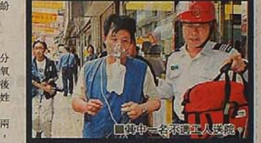
其中一名不識工人送院。