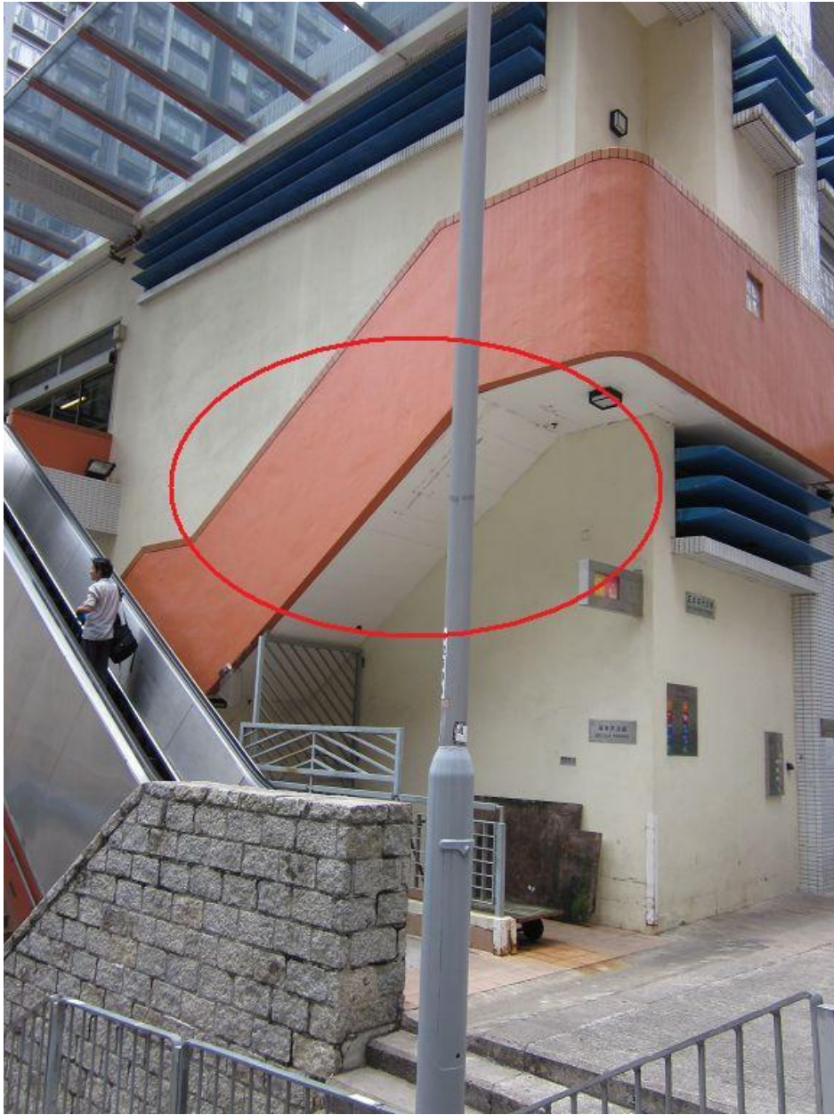
建議拆除紅圈處樓梯