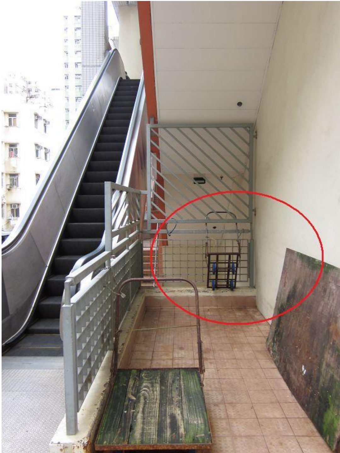
市民可從該處直達第三街無須經正街