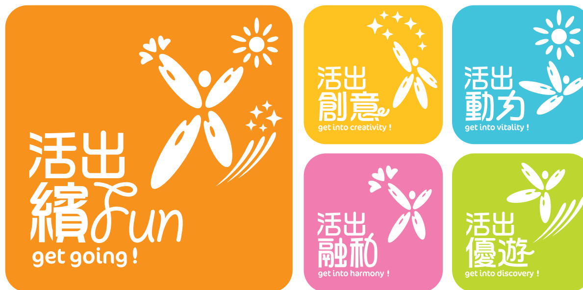
標誌應用 - 單色