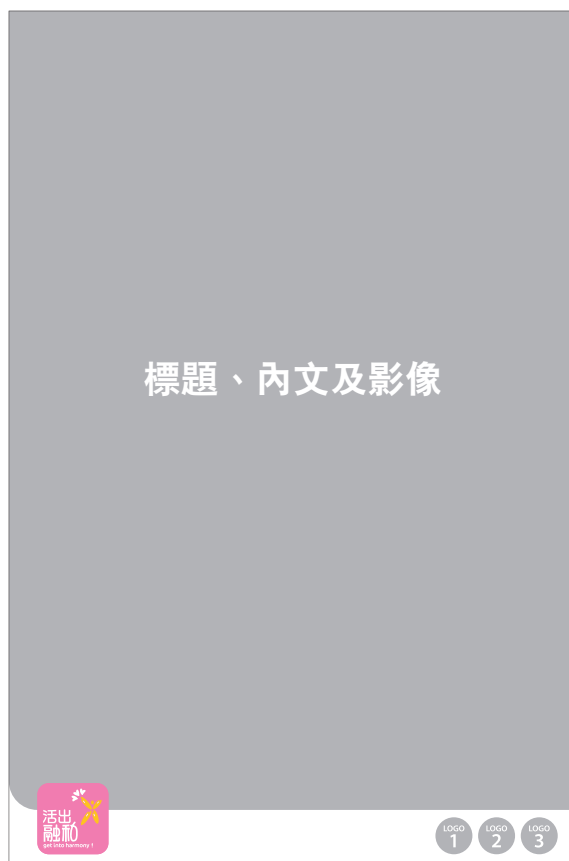
副題標誌 - 擺放左下角