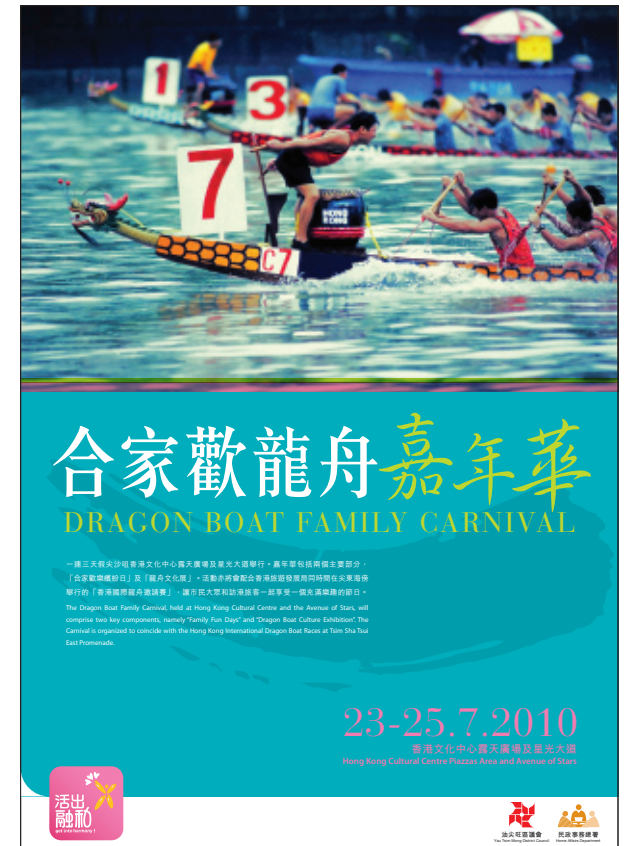
副題標誌 - 海報