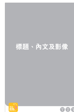
主辦團體、協辦機構及贊助團體 - 擺放右下角