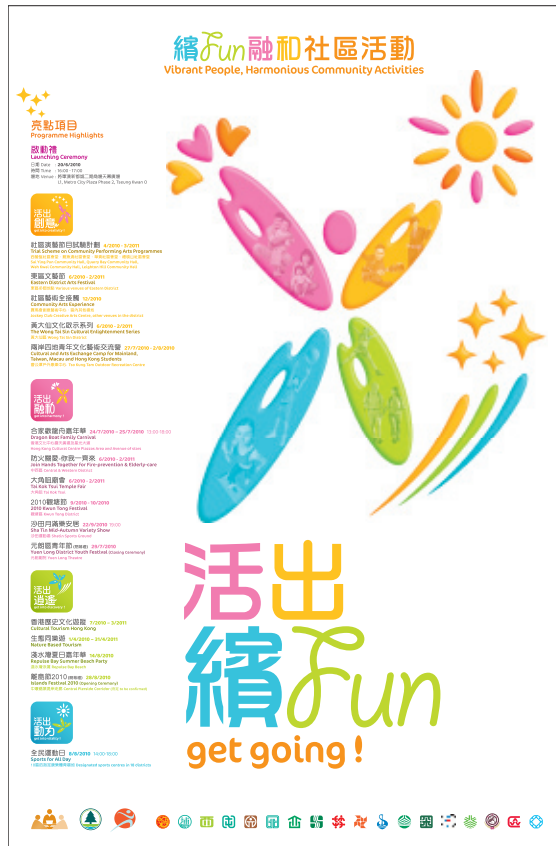
主題及副題標誌 - 海報

社區活動海報設計展示了副題標誌最適宜放於左下角、而主辦團體及協辦機構的標誌則放在右下角。