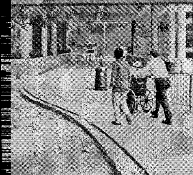
邱伯行動不便，每次乘搭巴士均需花上半小時兜路前往。

房署購得電動爬樓梯機，令屋邨通道更趨安全。但四名舊衣廠邨居民卻因巴士站外沒有「直上直下」的輪椅使用卻「唔識行」。居民質疑房署是否考慮到殘障人士需要的同時，原來房署早已派員到廠視察，但當居民借用時，職員竟以「女人手推」等理由婉拒，叫人啼笑皆非。