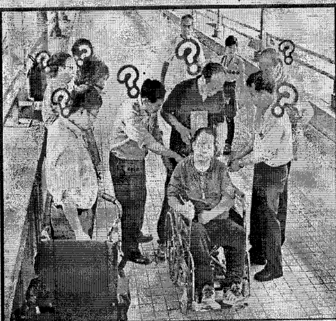
房署七名職員研究多時，仍然無法操作電動爬樓梯機，傷殘人士被「舞」良久，一臉無奈。

已購置「電動爬樓梯機」供有需要住戶使用。但是記者陪同邱伯致電管理公司要求借用的時候，接線職員竟以不同理由推搪。「部機淨係畀長者邨居民用，拎過嚟好麻煩，仲要人幫手推先用，我哋呢度多數人未接受過訓練，唔識用部機。」