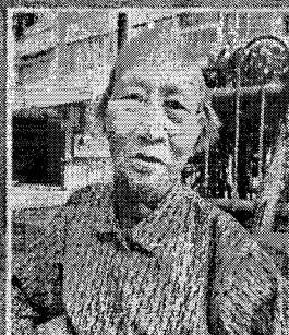
區梁婆婆：「我日日搭巴士都要攞樓梯，好辛苦！」