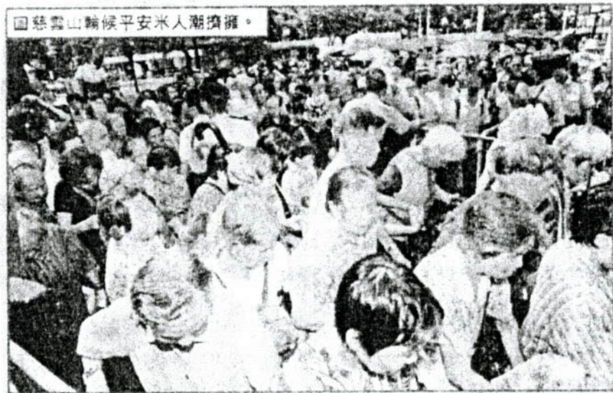
圖慈雲山輪候平安米人潮擠擁。