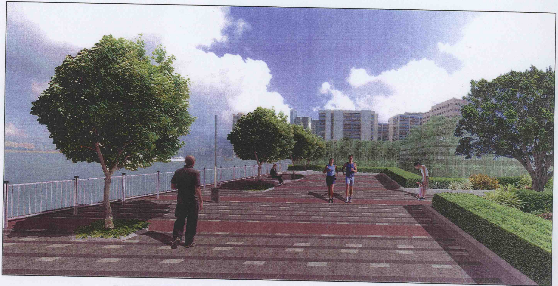
附件(2) - 擬建土瓜灣檢管站之初步設計圖 - 景觀(2)