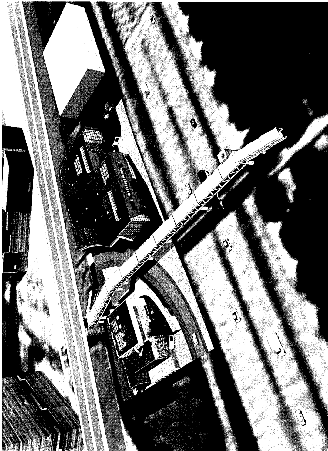
工程合約編號 DC/2009/21 - 佐敦谷箱形雨水渠污水截流工程 模擬外觀設計