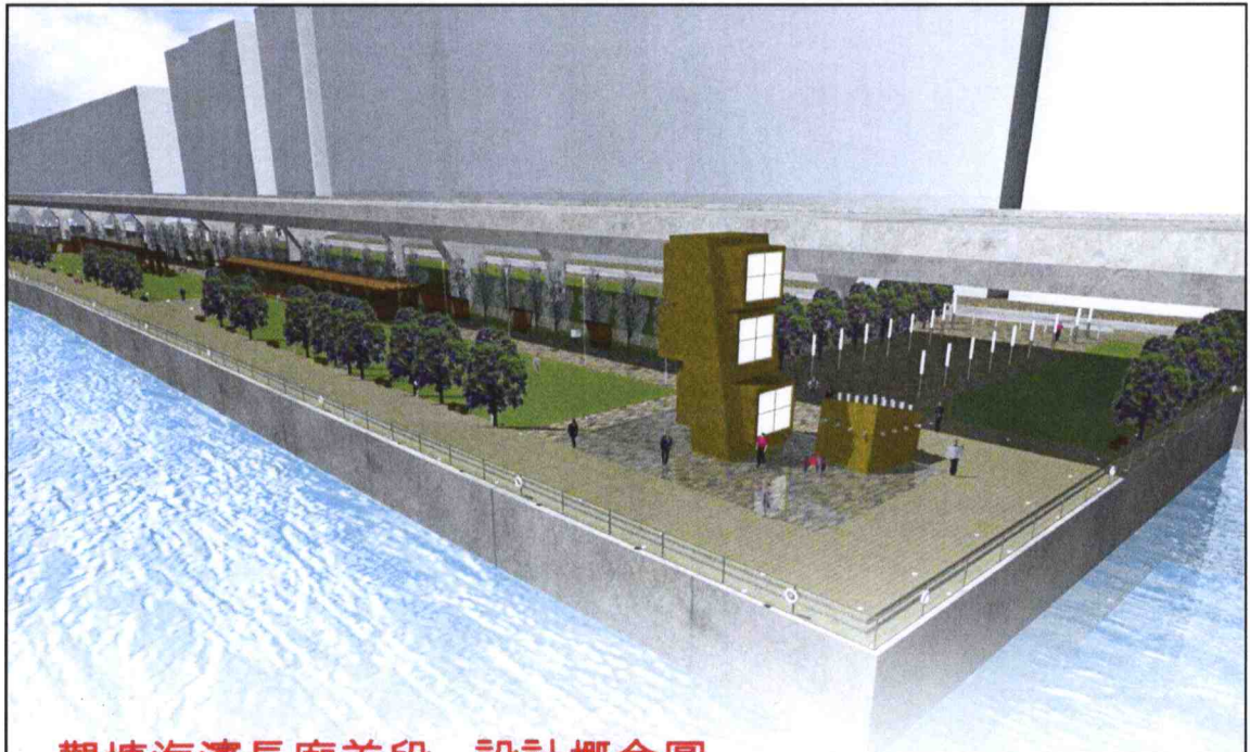
觀塘海濱長廊首段 - 設計概念圖