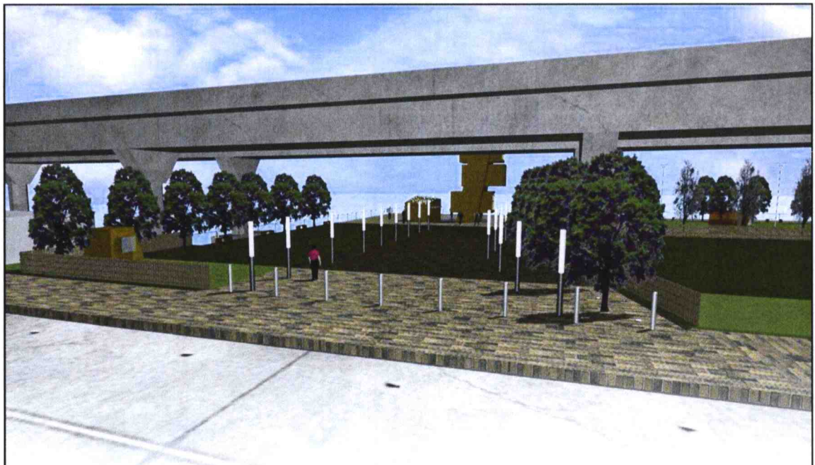
觀塘海濱長廊首段 - 設計概念圖