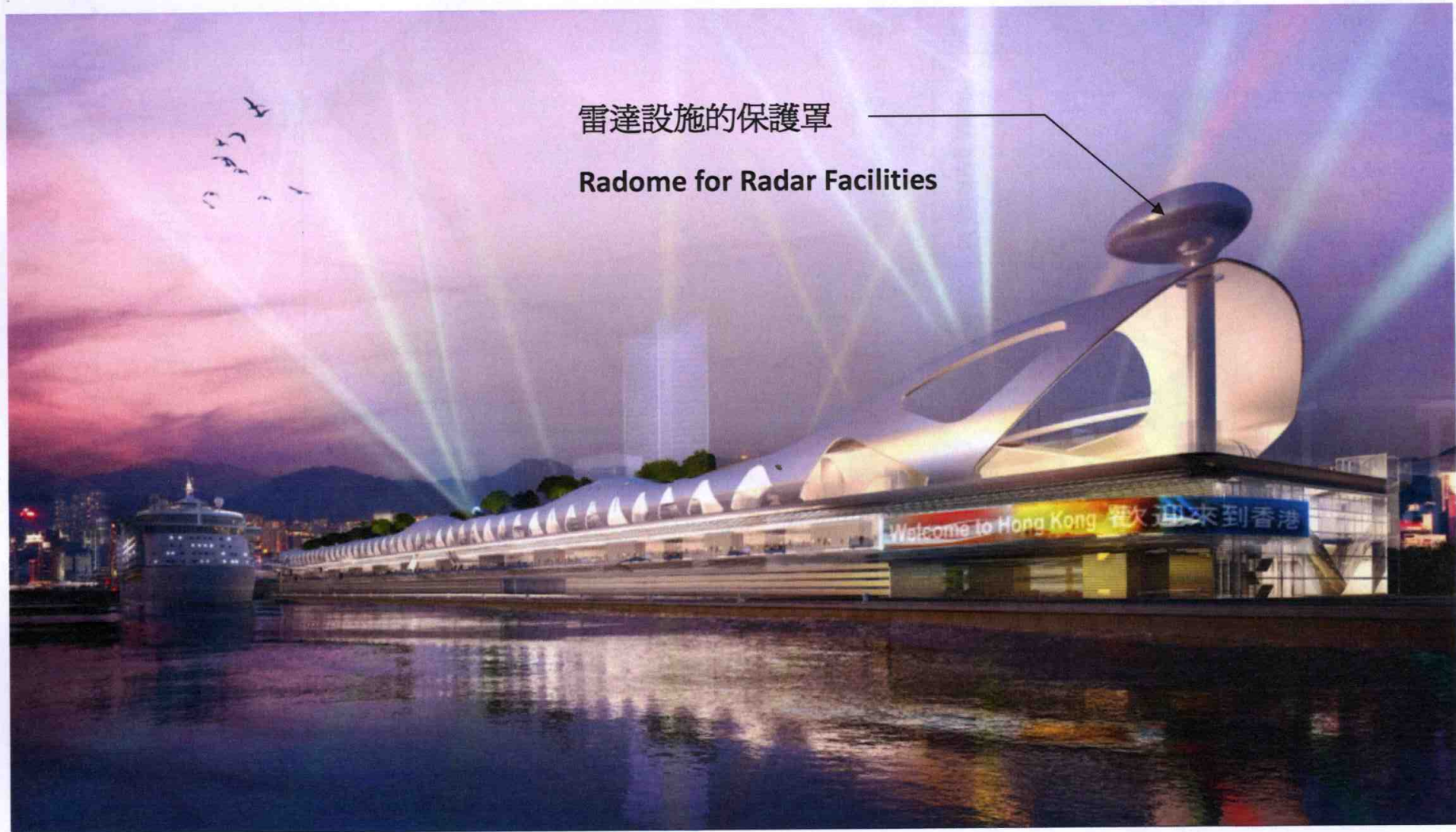
啓德郵輪碼頭大樓上的雷達設施構思圖

Artist's Impression of Radar Facilities on top of the Cruise Terminal