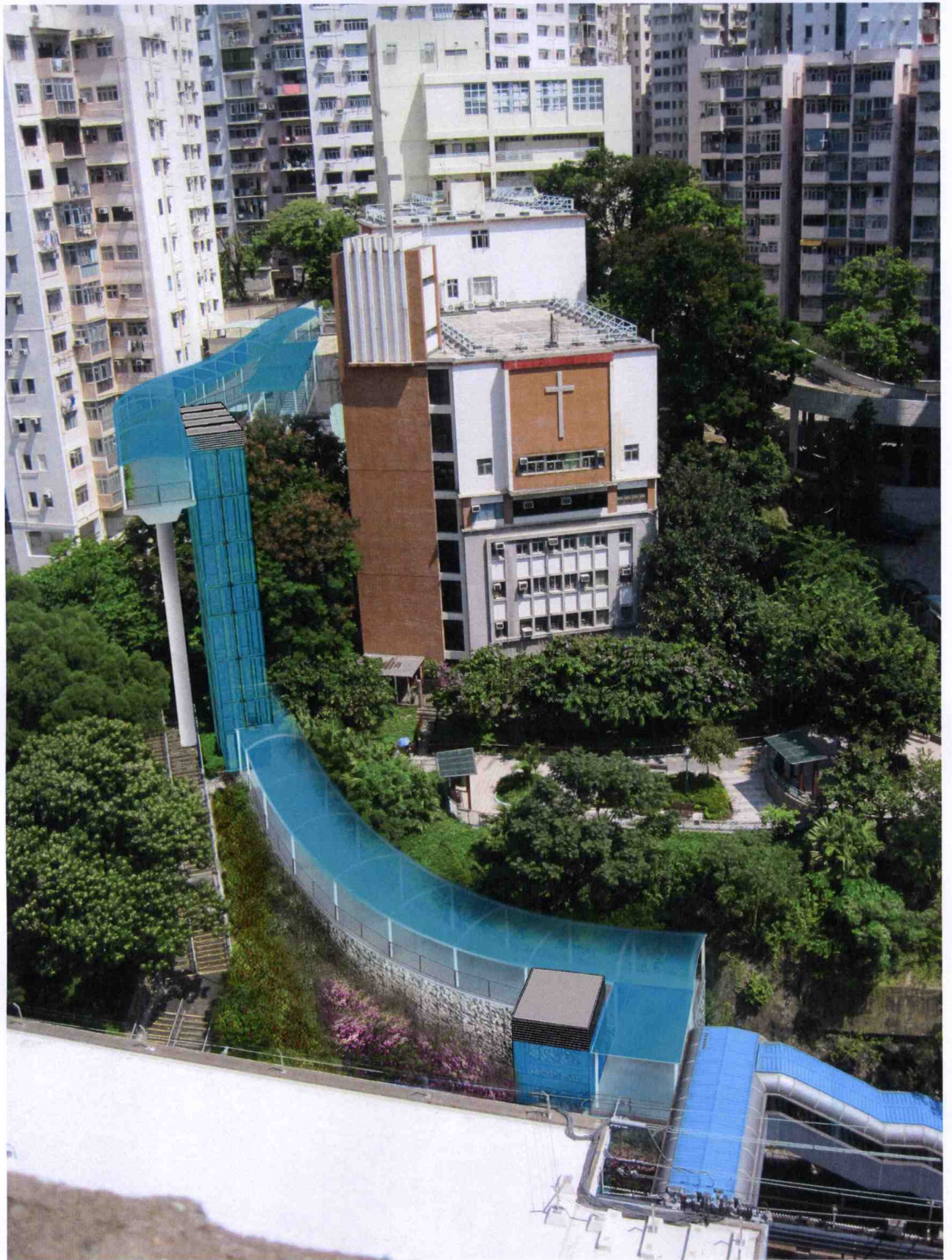
月華街架空行人通道模擬圖