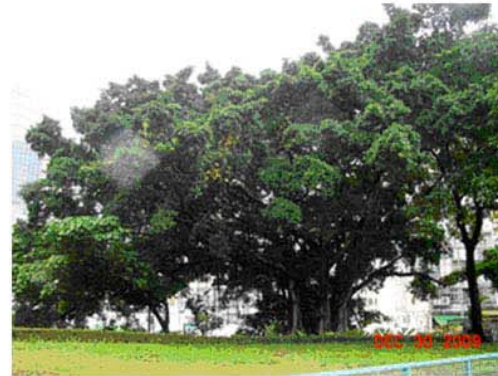
YUET WAH STREET SITE PHOTO RECORD TREE T99 月華街項目 - 細葉榕樹T99實地相片

RECEPTOR SITE FOR TRANSPLANT TREE T99 AT YUET WAH STREET PLAYGROUND 細葉榕樹T99於月華街公園內的移植位置