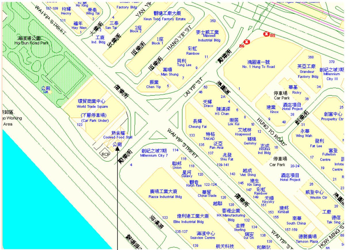
Lai Yip Street Public Toilet (勵業街公廁)