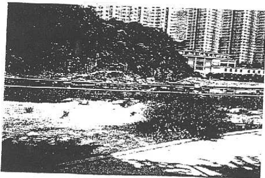
(圖三) 雜草生長於行人路兩旁， 令環境大為失色