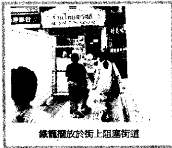
鐵籠擺放於街上阻塞街道

過去一年，地政總署轄下的分區地政處共接獲 323 (45)*宗有關回收舊衣活動的投訴，大部份涉及阻塞街道、