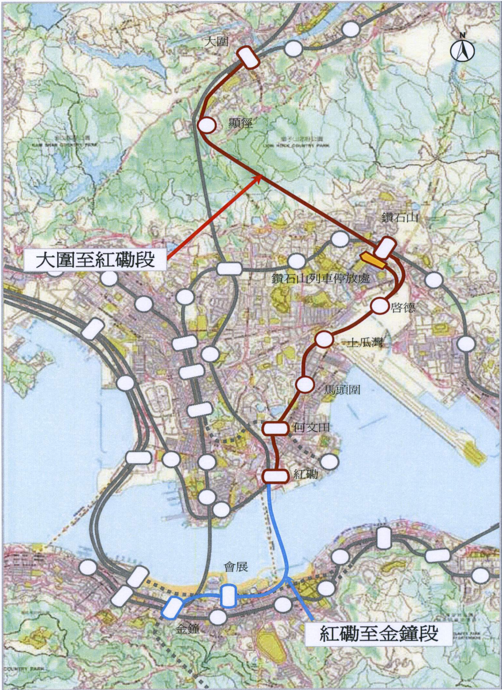
沙田至中環綫方案