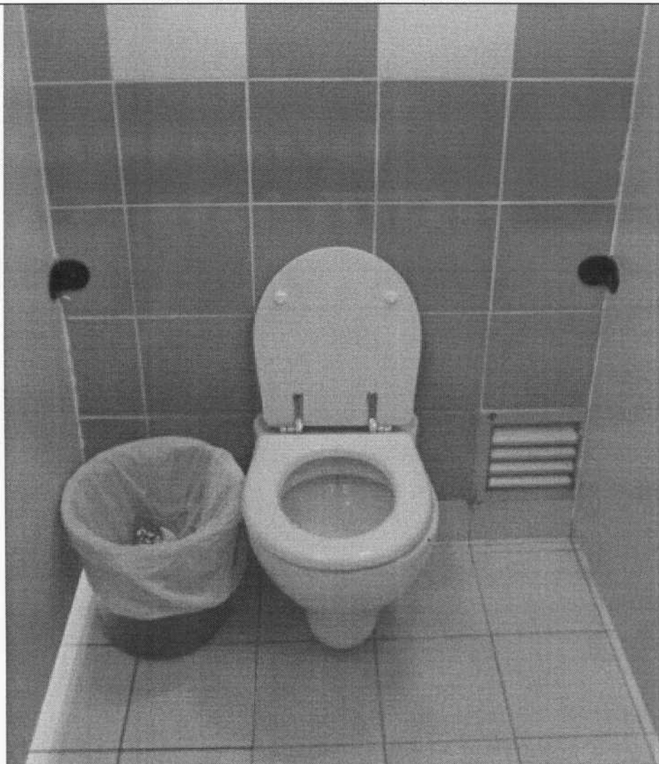
擬更換的兒童專用坐廁樣板