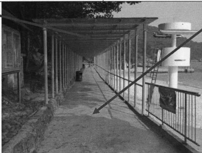
(ii) 於泳灘行人小徑地面加鋪地磚