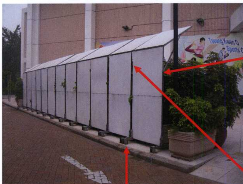
現時支架已呈老化的隔音屏