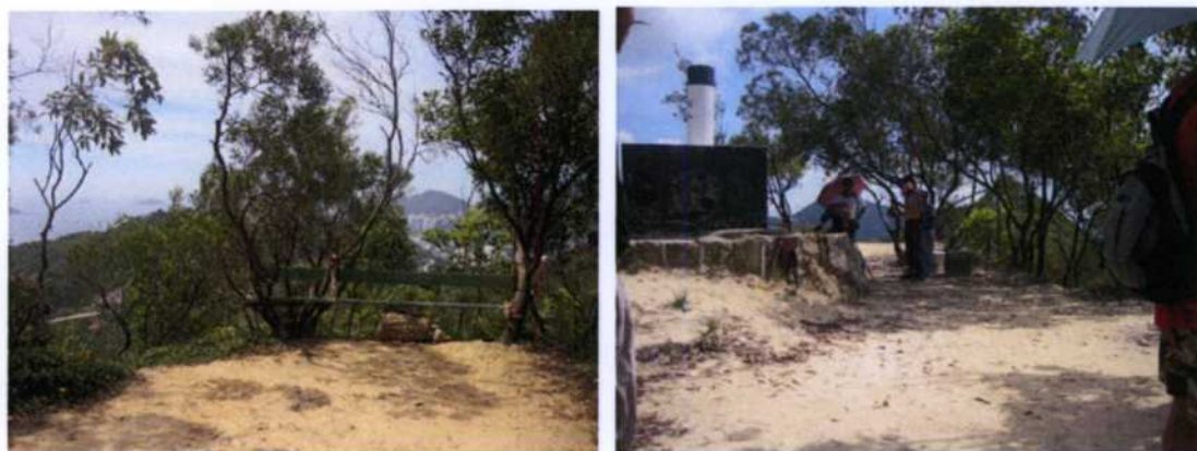
圖三：五桂山亭外行山人士自行搭建的長椅