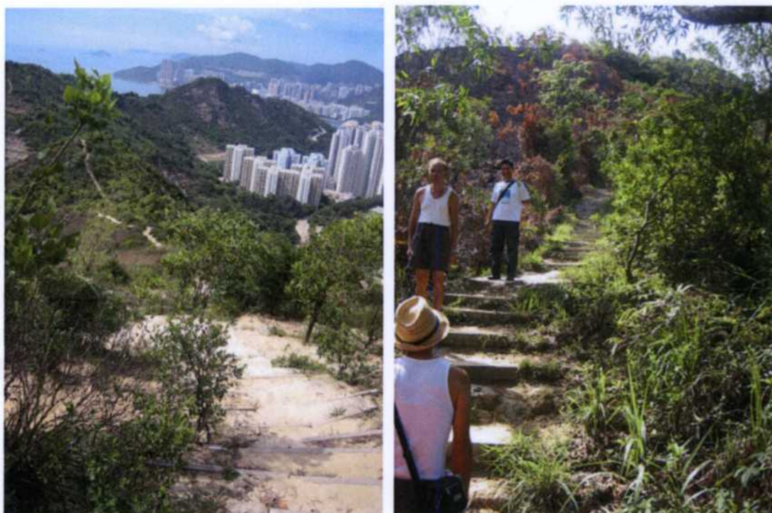
圖一（左）：該段衛奕信徑部份位置