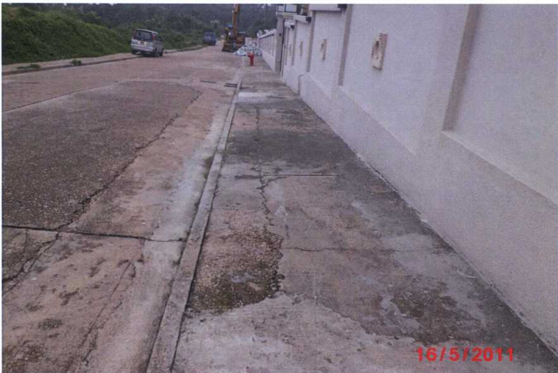
擬改善的坑口永隆路下段