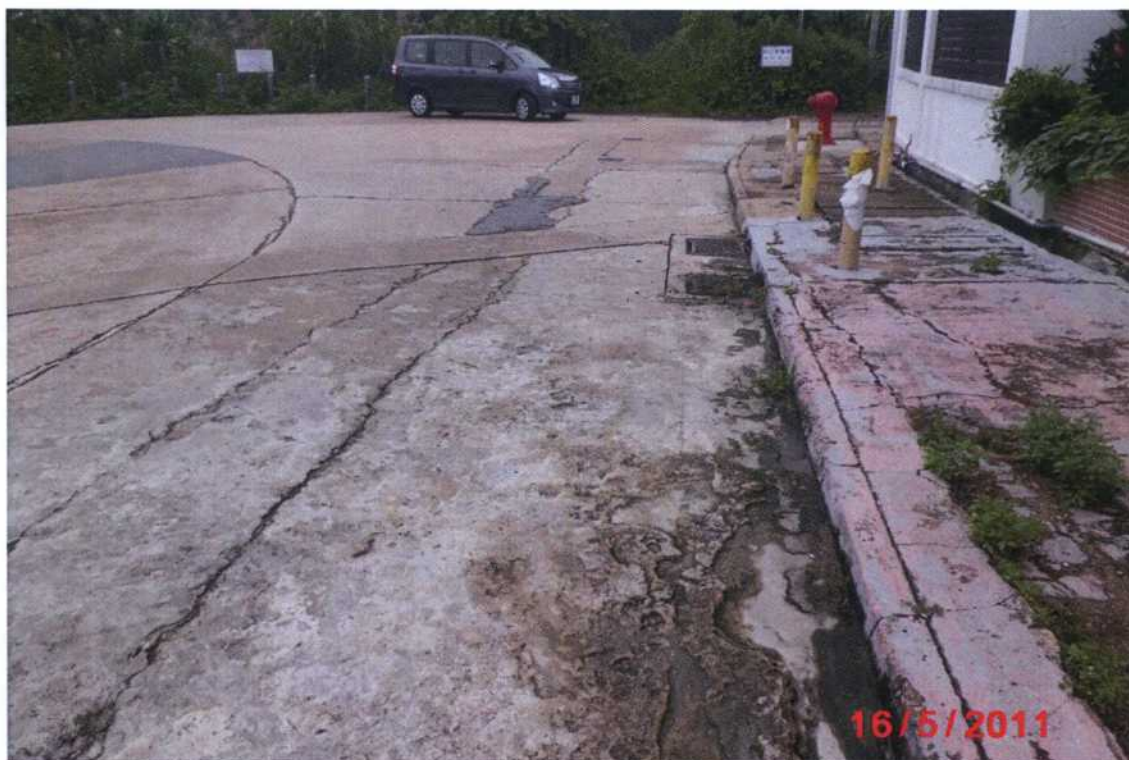
擬改善的坑口永隆路下段