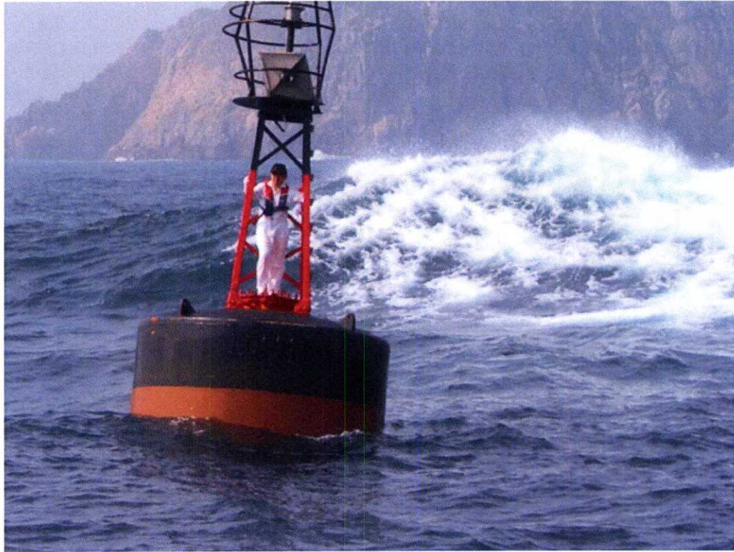
在一尺排的大浪 Severe Wave Condition