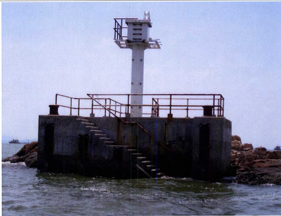
擬建造的登岸台和有燈航標 Proposed Landing and Lighted Beacon