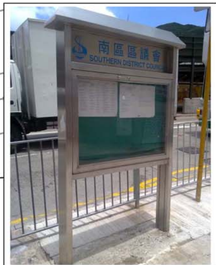
Existing Notice Board of Southern District Council to be Temporarily Relocated 現有南區區議會告示牌將臨時重置