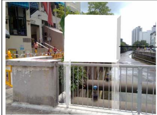
Proposed Temporary Location for Notice Board of Southern District Council at Side of Nam Long Shan Road Bridge 現有南區區議會告示牌將會臨時置在南朗山道橋側