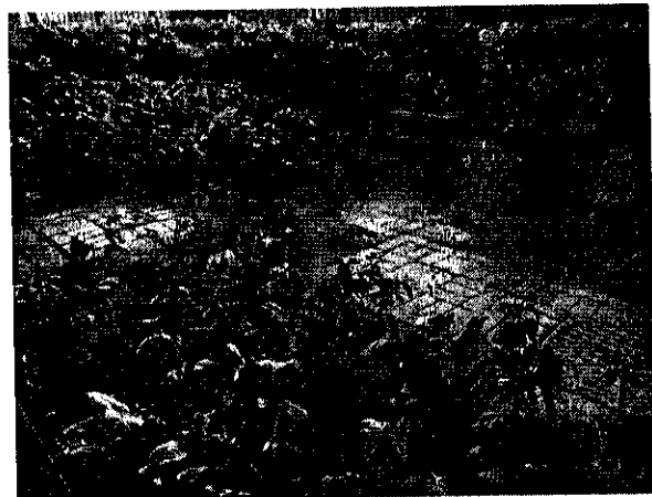
在水渠蓋四周的植物出現片片荒蕪