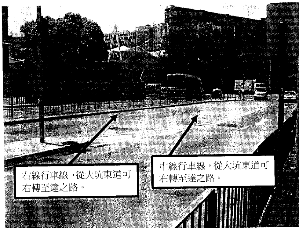
從界限街駛入大坑東道後共有三條行車路，當中兩條行車線均可右轉駛入達之路。