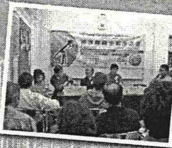
顧客聯絡小組座談會