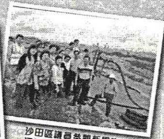
沙田區議員參觀新界東北堆填區沼氣淨化廠