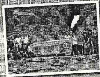
香港地質及地質考察