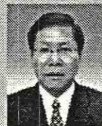
沙田區議會主席 李國洪先生SBS,JP