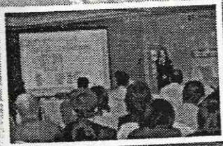
第七屆沙田區優質大廈管理比賽簡介