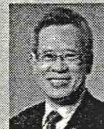
沙田區議會副主席 彭長輝先生BBS,JP