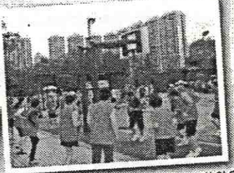
沙田區議會龍舟競渡代表隊於比賽前熱身